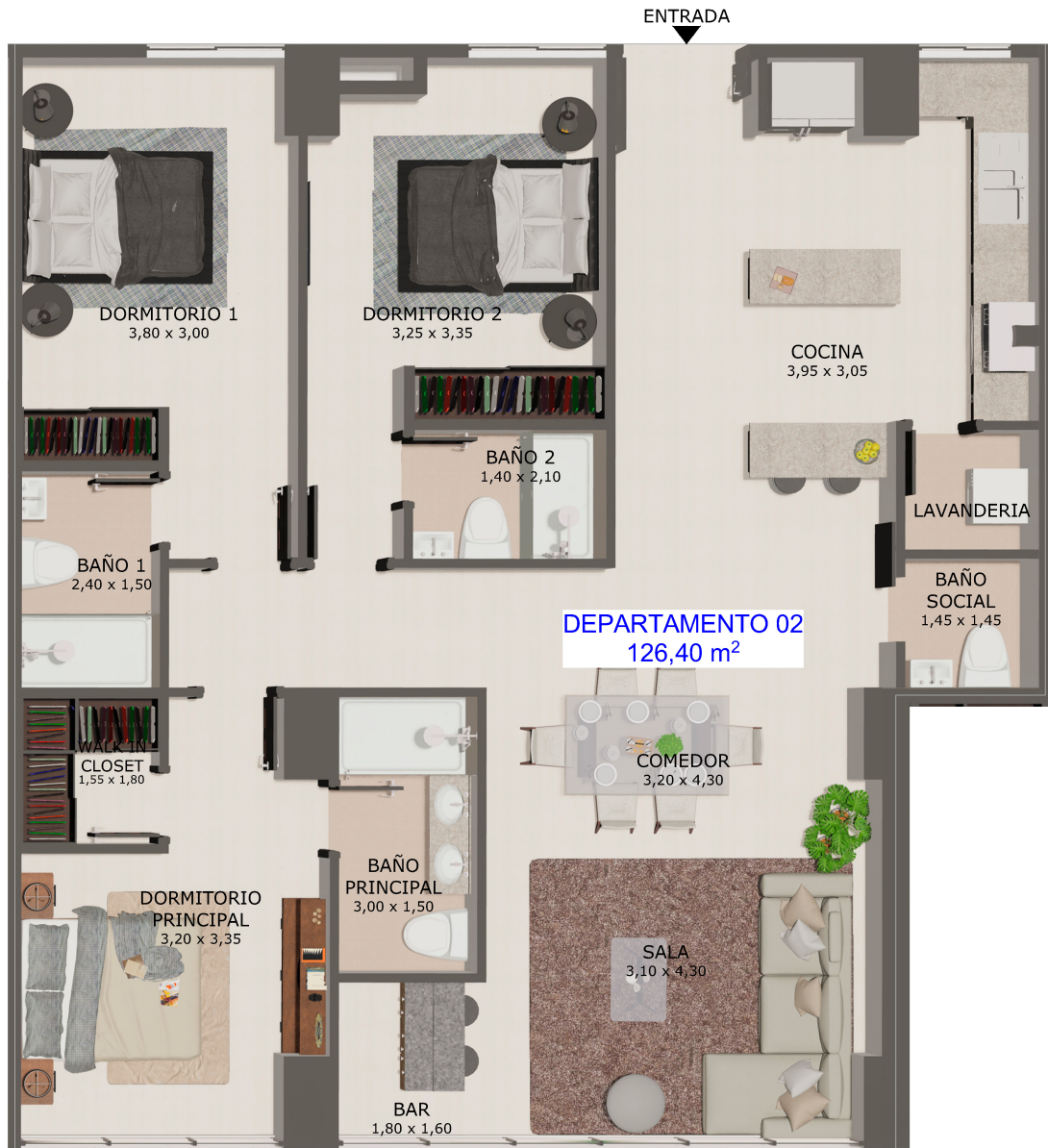
DEPARTAMENTO 02 (3D)