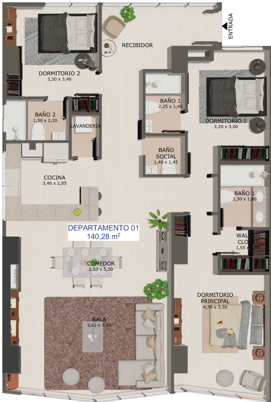
DEPARTAMENTO 01 (3D)