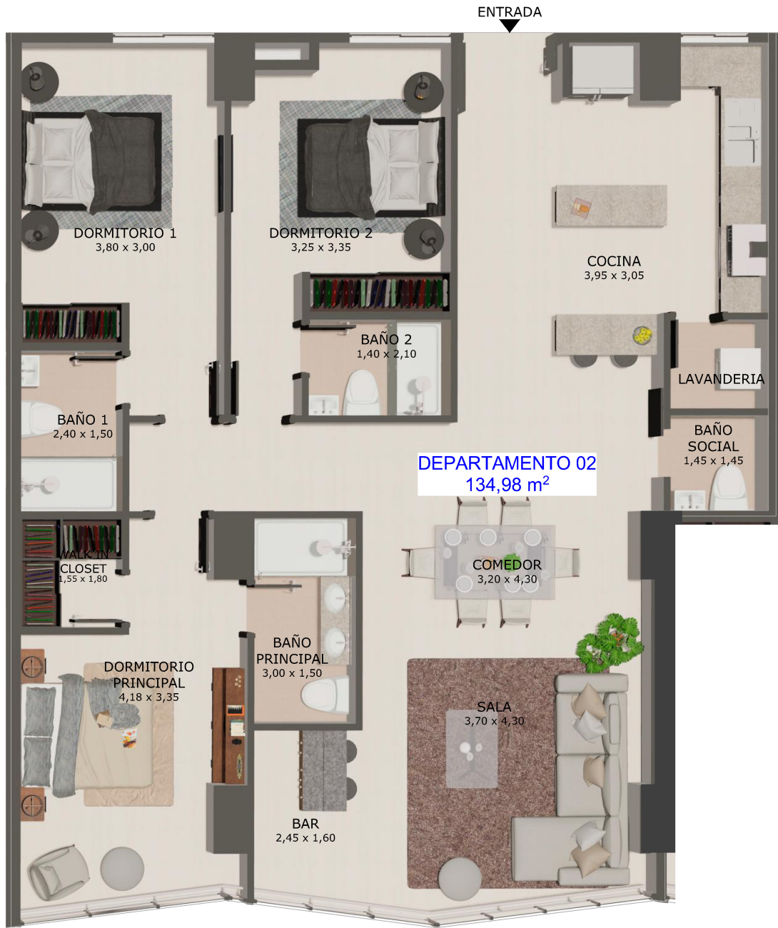
DEPARTAMENTO 02 (3D)