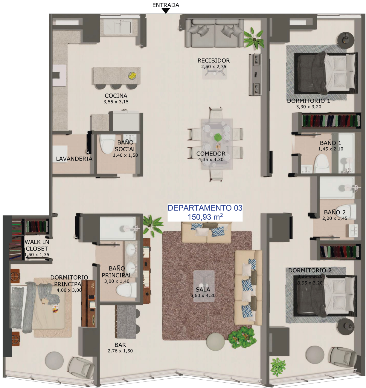
DEPARTAMENTO 03 (3D)